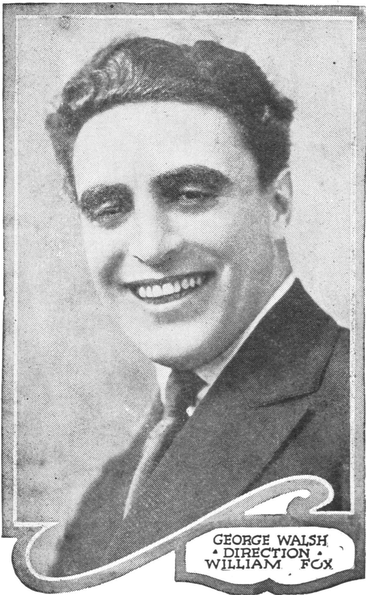
GEORGE WALSH • DIRECTION • WILLIAM FOX